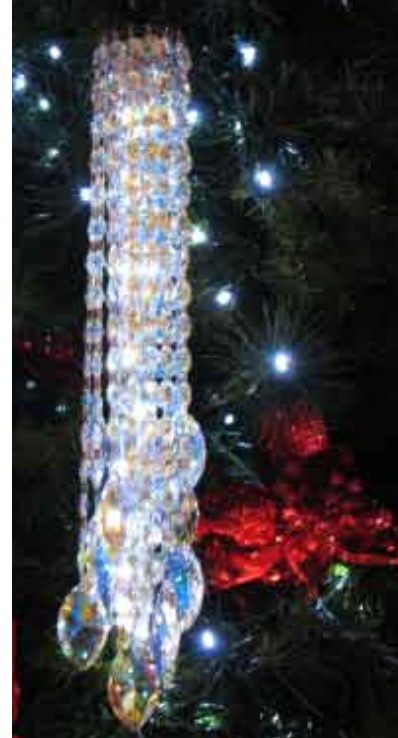
Above left and centre: the Swarovski Christmas Tree in the Queen Victoria Building. Above right: a Swarovski crystal ornament, lit internally by LED lights.

S hoppers and sellers have gone home. The stores are closed. Boutiques wait silently, patiently, for the start of a new retail day. Then the stillness is broken.